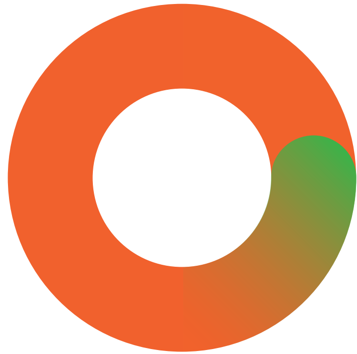
한글 로고 + 모티브 조합형